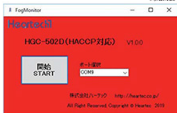
エラー画面（点滅と警告ブザー）